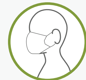
MASQUE SANS COUTURES FABRIQUÉ À PARTIR D'UNE ÉCHARPE PLIÉE OU D'UN BANDANA ET D'ÉLASTIQUES OU D'ATTACHES POUR LES CHEVEUX

Pour en savoir plus sur la fabrication de couvre-visage, veuillez consulter le site suivant : www.canada.ca/fr/sante-publique/services/maladies/2019-nouveau-coronavirus/prevention-risques/instructions-revetement-visage-tissu-cousu-non-cousu.html#a5